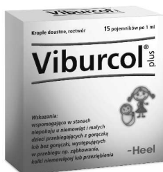
Krople doustne Viburcol

Viburcol zawiera naturalne składniki, bez dodatku cukru, środków barwiących i konserwantów.